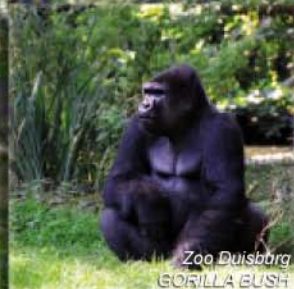
Zoo Duisburg GORILLA EUSH