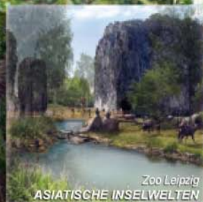
Zoo Leipzig ASIATISCHE INSELWELTEN